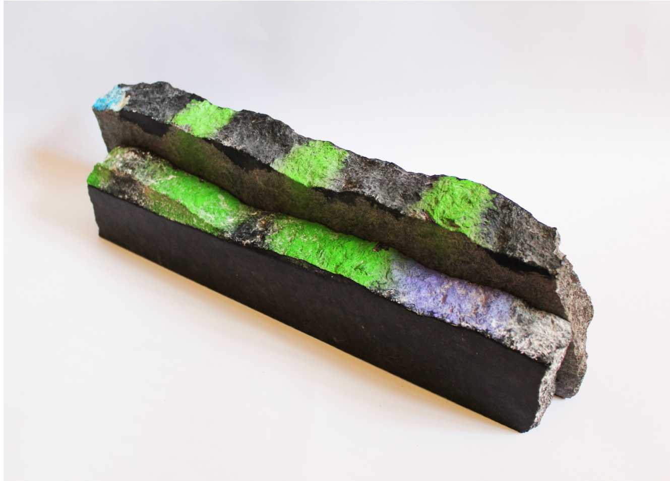
“Sintagma VII” Granito y pigmentos 10x50x20cm 2018.